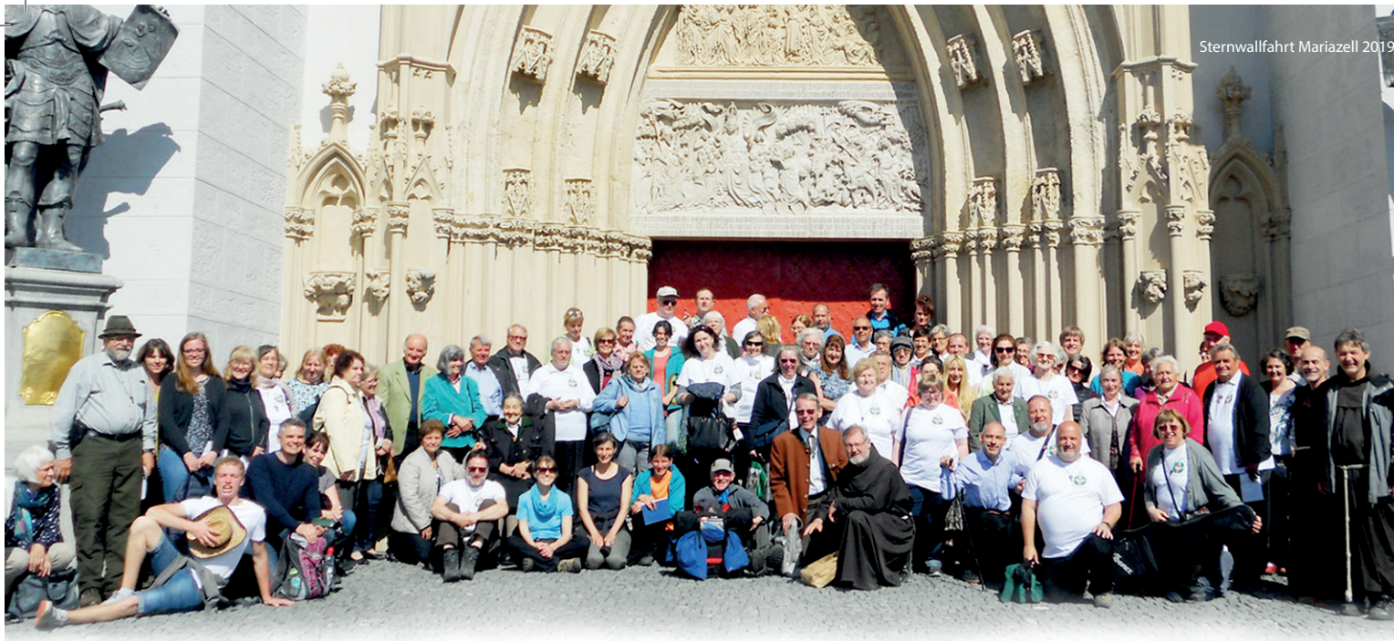
Sternwallfahrt Mariazell 2019